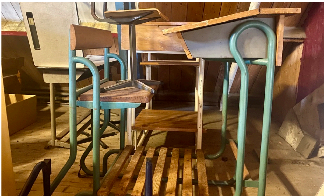
Het oudste schoolbankje op de zolder van de Jozefschool